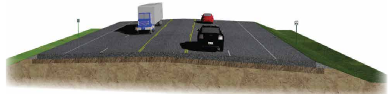
SECCIÓN ABIERTA DE CINCO CARRILES

UN EMPLEADOR CON IGUALDAD DE OPORTUNIDADES